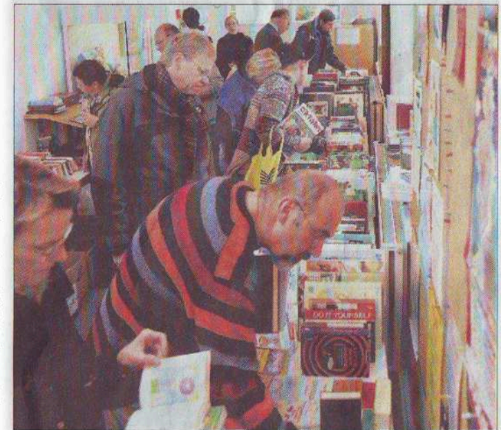
Reges Interesse am Bücherflohmarkt: Dieses Angebot des Fördervereins „Buch und Kunst“ beschert der Bibliothek Spendengelder.